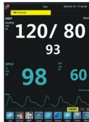
Pantalla de Números Grandes