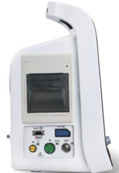
Vista Lateral (Impresora Opcional)